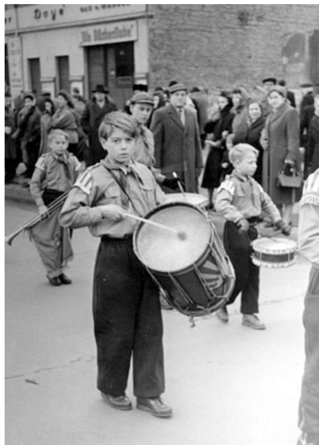
Junger Pionier